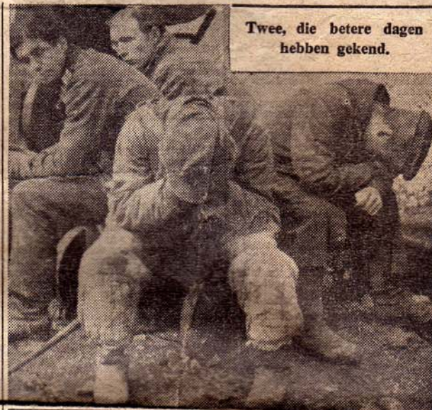
Twee, die betere dagen hebben gekend.

De Tactische Luchtmacht maakt van iedere opklaring in het weer gebruik om de oprukkende troepen te ondersteunen. Het vijandelijke afweervuur is hevig, vooral langs de oevers van den Rijn. De Duitschers gebruiken o.a. treintjes uitgerust met afweergeschut er op. De luchtverkenning heeft groote aantallen lichters op den Rijn waargenomen, in het bijzonder op bepaalde veerpunten. Een eerste Duitse poging om troepen in Oostelijke richting over den Rijn te brengen, werd onmiddellijk met een felle beschieting door de Geallieerde jager-bommenwerpers beantwoord.