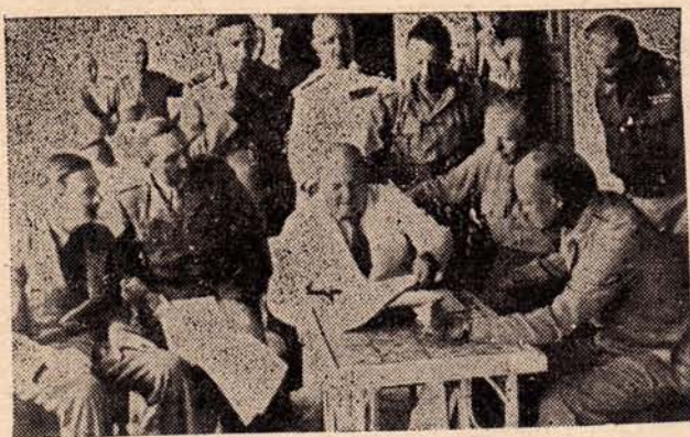
Churchill en Eden vol belangstelling voor de militaire gebeurtenissen.

„We zouden zoo graag van U hooren, wat V1 nu eigenlijk beteekent.”