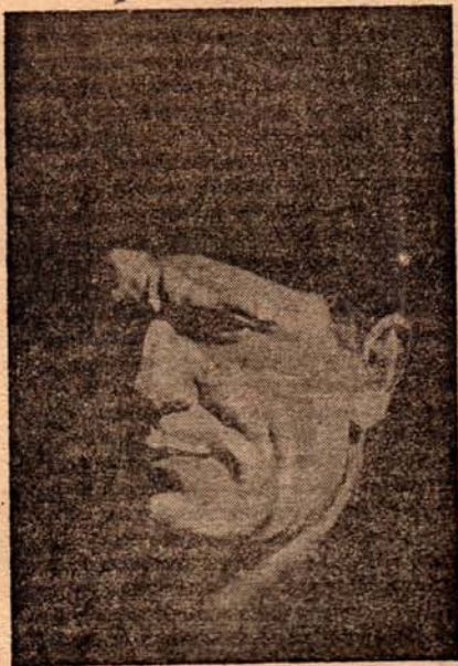
Maarschalk Tito, die het bevel voert over een leger van 250.000 Joegoslavische partizanen.

Op deze wijze is een systematisch vernielen van fabriekscomplexen mogelijk: een reeds getroffen deel wordt namelijk niet overbodig gebombardeerd."