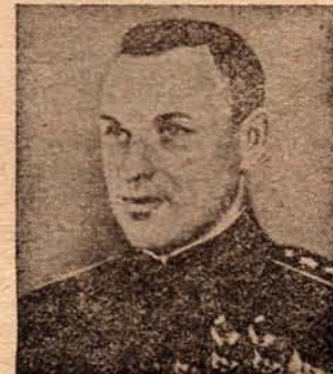
9. Generaal K. K. Rokossovsky drager van de orde van Suworow, opperbevelhebber van het Eerste Wit-Russische Front; veroverde Rogatsjef, waardoor hij de weg naar Minsk opende.