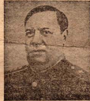
6. Generaal P. I. Tolboechin, drager van de orde van Suworow, opperbevelhebber van het Vierde Oekraïnsche leger, overwinnaar van Taganrog en Melitopol.