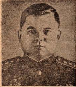
1. Generaal Nicolai Watoetin, opperbevelhebber van het Eerste Oekraïnsche leger, drager van de orde van Suworow; Hij heroverde Kief