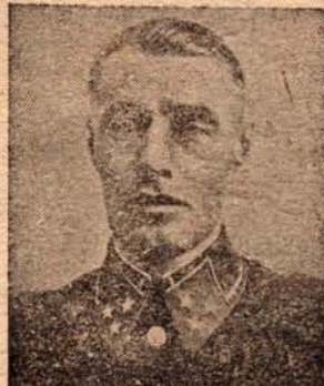
8. Generaal Popof, drager van de orde van Suworow, opperbevelhebber van het Tweede Baltische Front, voorman bij de innamen van Orel en Bjelgorod. Onlangs nam hij Dnjo.