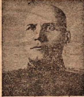
2. Maarschalk Iwan Konjef, drager van de orde van Suworow, opperbevelhebber van het Tweede Oekraïnsche leger; zijn laatste overwinning was de vernietiging van het Achtste Duitse leger.