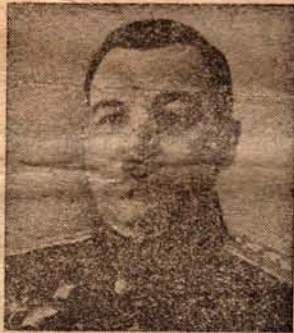
4. Generaal K. A. Meretskof, drager van de orde van Suworow, opperbevelhebber van het Wolkof front, de veroveraar Nowgorod Starya Russa en Pskow.