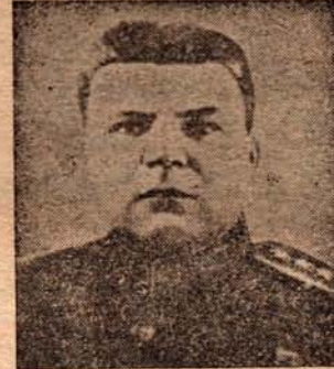
3. Generaal Malinofsky, drager van de orde van Suworow, opperbevelhebber van het Derde Oekraïnsche leger; onlangs veroverde hij Nicopol, en nam op 24 Februari stormerderhand Kriwoi Rog.