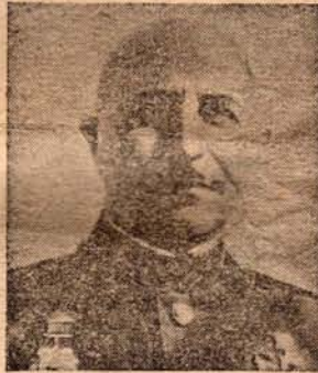
5. Generaal L. A. Govorof, drager van de orde van Suworow, opperbevelhebber van het front bij Leningrad, ontzette Leningrad, trok Estland binnen en belegerde Psov.