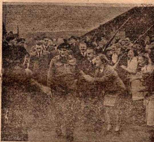
Generaal Montgomery, Opperbevelhebber der Britsche invasietroepen, tijdens een bezoek aan een wapenfabriek. De arbeiders, voor een groot gedeelte vrouwen en meisjes, verbreken de afzetting om den populairren Generaal de hand te drukken.

De Indonesiërs, de Chinesche ingezetenen en de Europeesche burgerij, die thans onder het harde juk van Japansche heerschappij gebukt gaan, kunnen zich slechts sterk voelen in de zekerheid van de komende bevrijding. Die bevrijding, waartoe Nederlandsche en Geallieerde troepen schouder aan schouder zullen staan, zal Indië op den weg der ontwikkeling brengen als gelijkgerechtigd en zelfstandig deel van het Koninkrijk der Nederlanden.