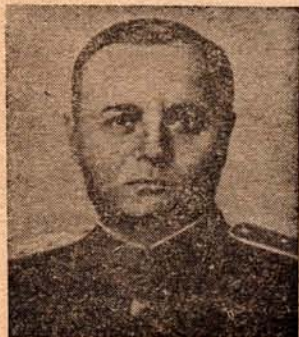
7. Generaal Iwan Bagramyan, opperbevelhebber van het Eerste Baltische front; leidde het succesvolle offensief bij Nowel; staat tegenover de Finnen.